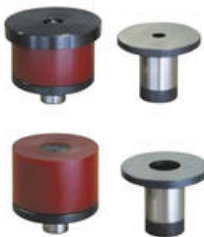
Kruhový razník a matrice

Nožný spínač s funkciami Štart - Stop - Vyp. 03865