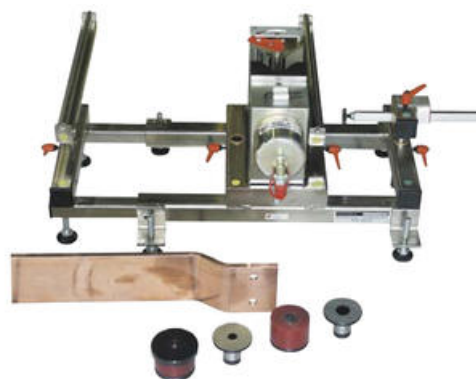
Obj.č. 03256 Dodávka bez razníkú a matric