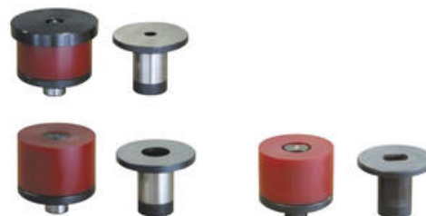
Kruhový razník a matrice