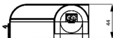
View of screw fixing

LED 122 (Size 2) L1 = 700 mm L2 = 675 mm